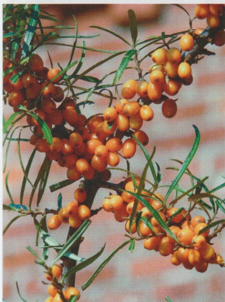
Knaloranje duindoornbessen. De boeren van Rügen weten er alles van te maken.