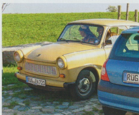
Oude Trabantjes pruttelen af en toe nog steeds door Oostelijk Duitsland. Nu ook elektrisch (!)